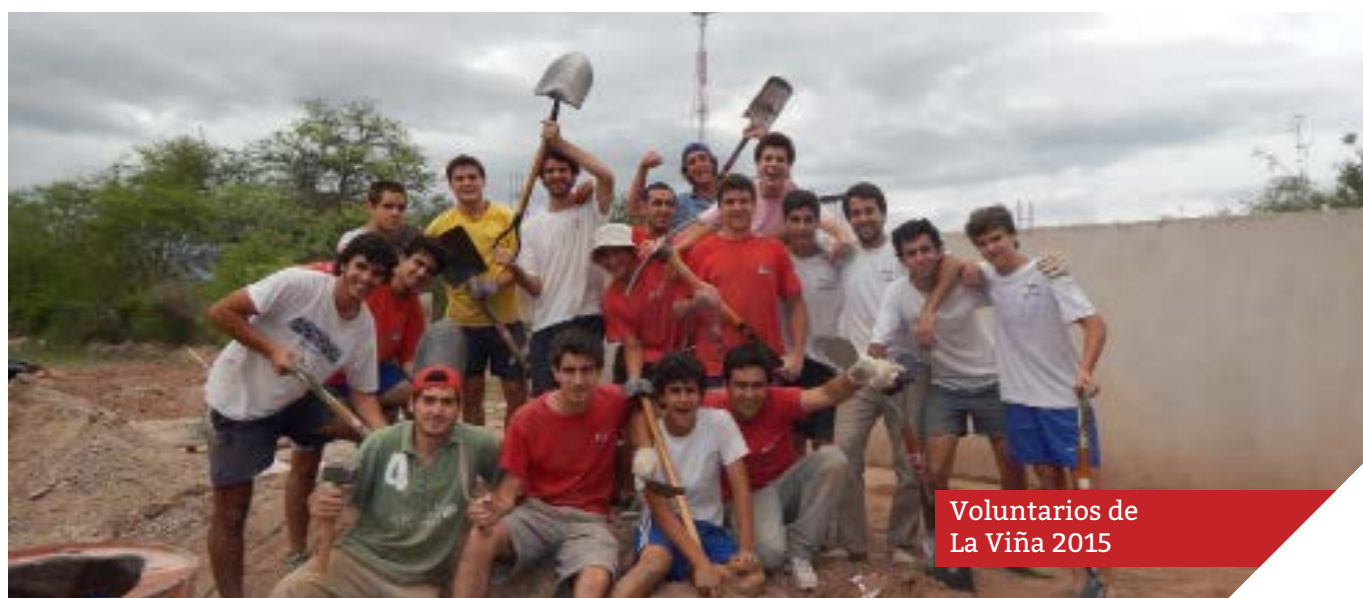
Voluntarios de La Viña 2015

La Asociación tiene como objetivo formar a los jóvenes que participan del viaje en las actitudes de solidaridad con los necesitados y sustentar los emprendimientos proyectados.